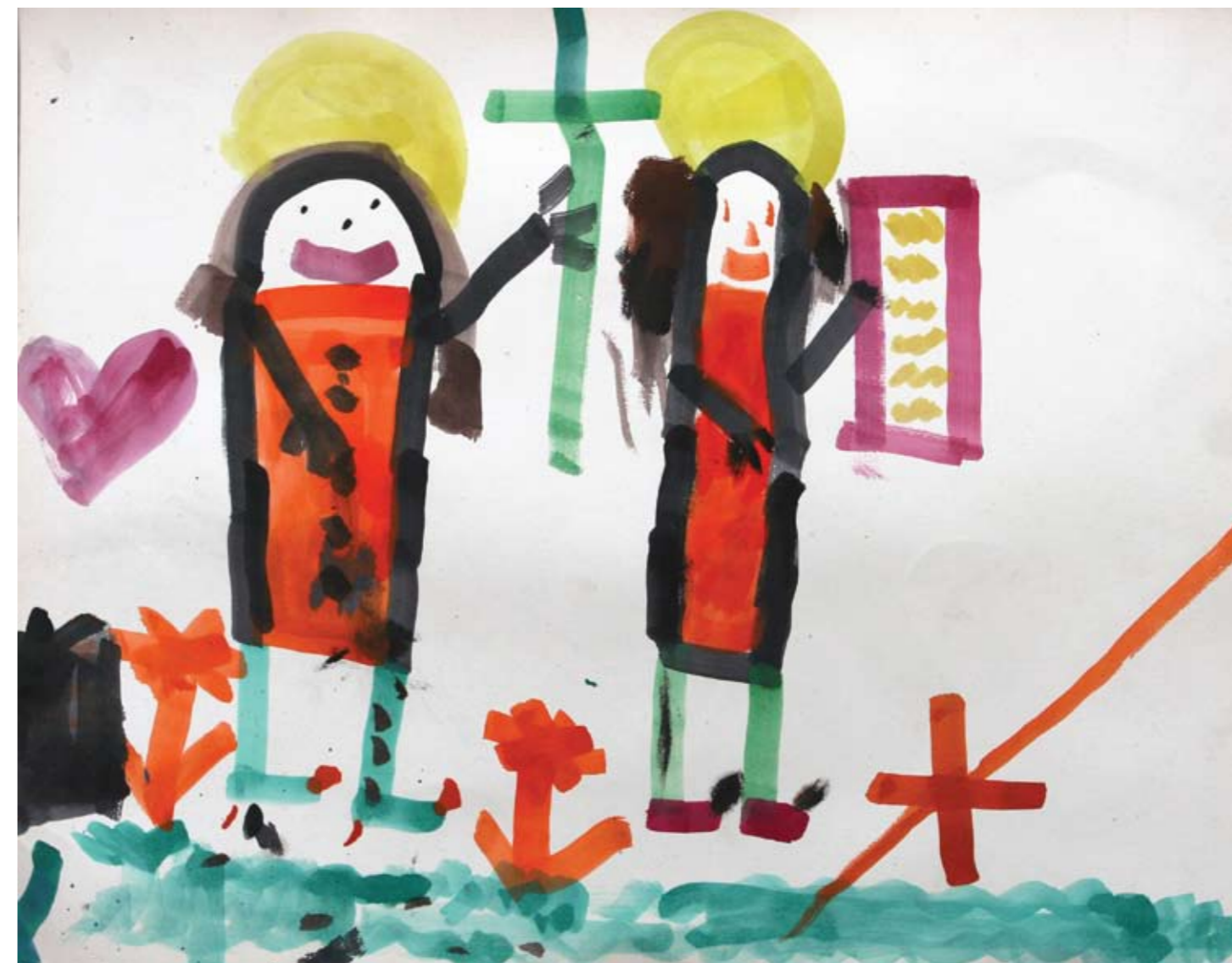
Róza Sofie Fialová